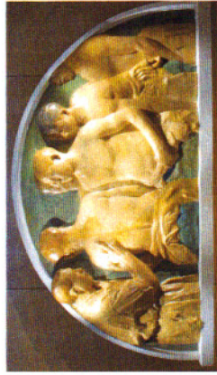
La vaccination antityphoïdique. Sculpture en cre de Jean Larrivé 1917 Musée du SSA au Val-de-Grâce